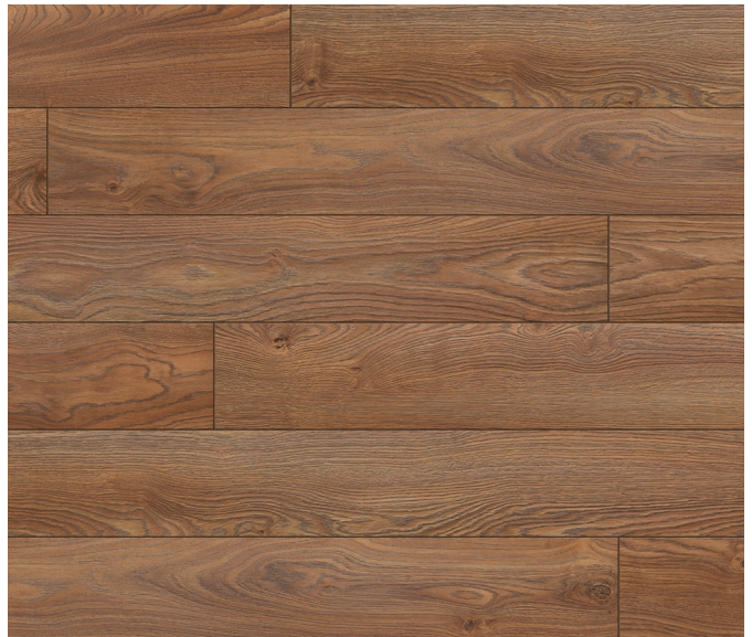
52805 Chêne Altea