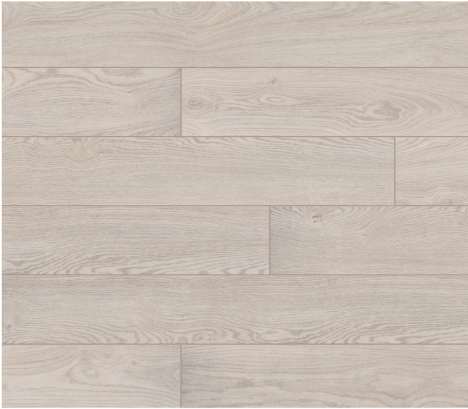
52799 Chêne Bassano