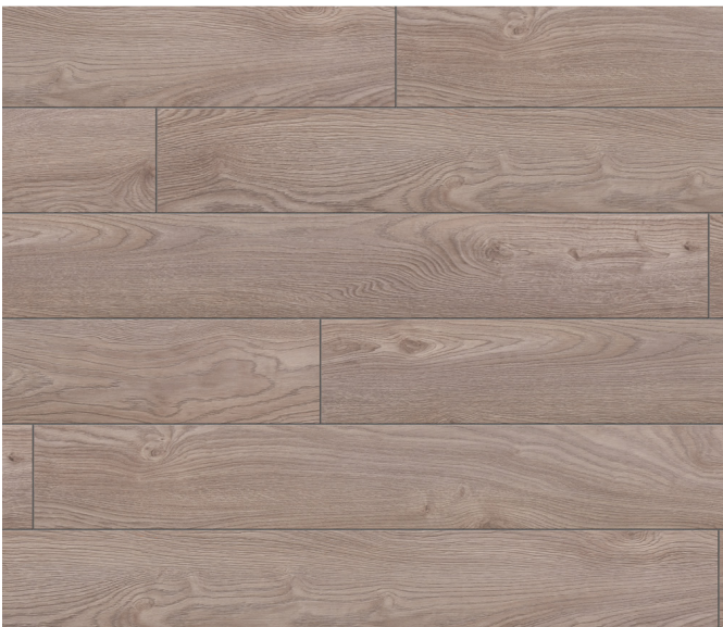
52804 Chêne Grenada