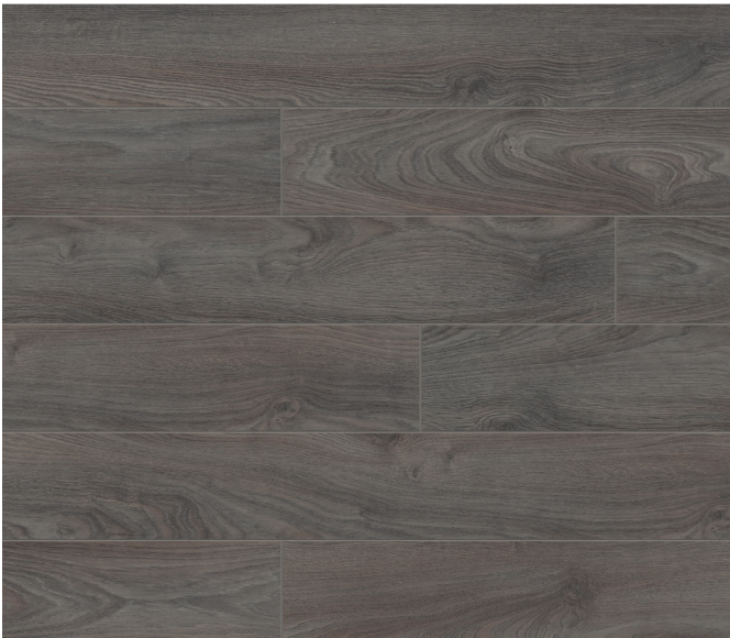
52800 Chêne Santana