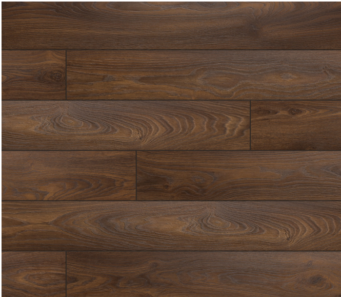
52803 Chêne Alicante