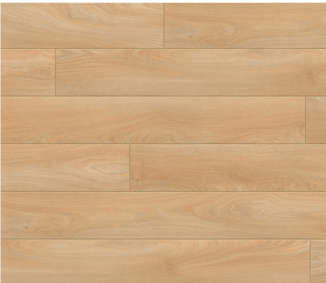
52801 Chêne Marbella