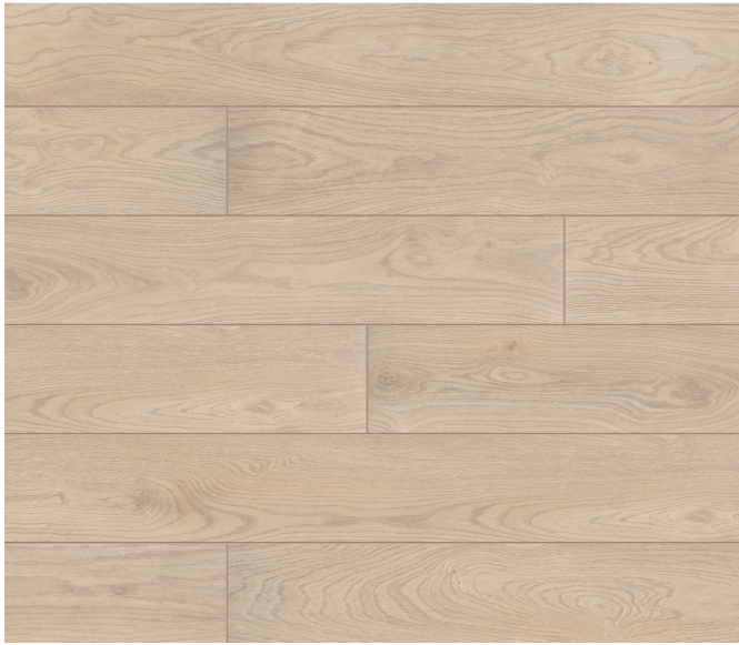
52802 Chêne Bilbao